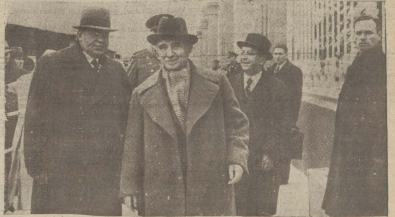
Millî Şefimiz motörden Dolmabahçe rıhtımına çıkarken

Cumhurreisimiz dün öğleden sonra şehrimizi şereflendirdiler