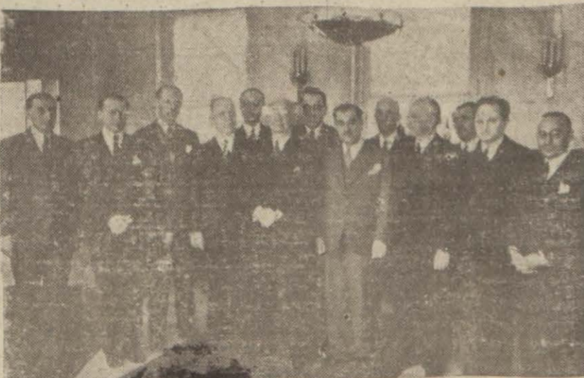
Başvekil tarafından jüri heyeti şerefine verilen öğle yemeğinde

Jüri heyeti birisi bir Türk, diğerleri Alman ve İtalyan sanatkarlarına aid üç projeyi seçti. Hükümet bunlardan birini seçerek birinciyi İlan edecektir.