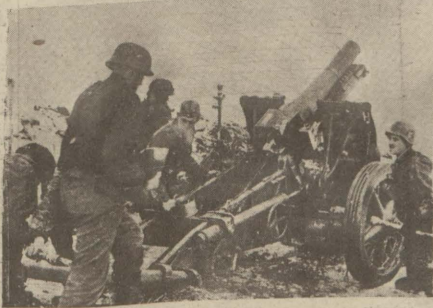
Rusyada ağır bir Alman topu ateş ederken

Tokyo 21 (A.A.) — Domei ajansının İhtarına göre Mayıstan itibaren Çunking'in Japon tayyareleri tarafından bombardıman edilmesini İhtimaline karşı bu şehirden kadın ve çocuklar başka yerlere nakledilmişlerdir.